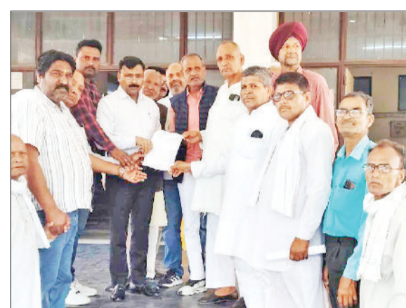
नारनौल। ज्ञापन सौंपते रिटायर्ड कर्मचारी।