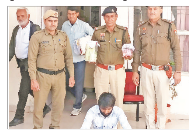
नारनौल। पुलिस गिरफ्तार में आरोपित।