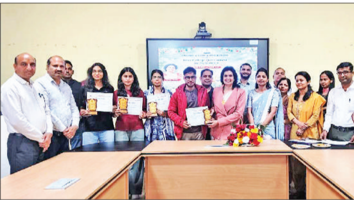
महेन्द्रगढ़। विजेता टीम को सम्मानित करते हुए।