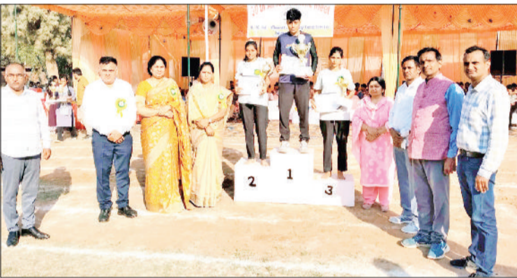
नारनौल। विजेता खिलाड़ियों को विक्ट्री स्टैंड पर सम्मानित करते हुए।